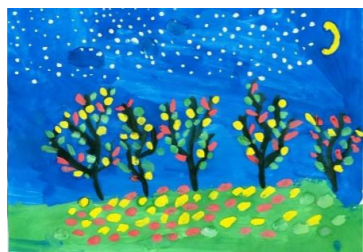
Рисунок Ясинской Марии, 5Б