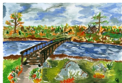
Рисунок Жуковой Саши, 5Б