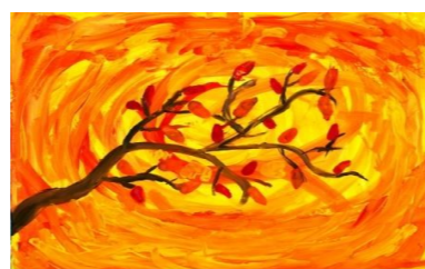
Рисунок Белецкой Василисы, 3Б