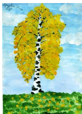
Рисунок Ярцевой Эйлы, 6В