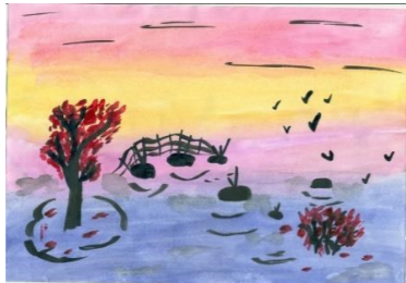
Рисунок Курилиной А, 7Г