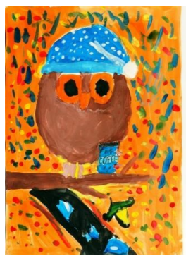
Рисунок Пахомовой Марьи, 5Б