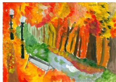
Рисунок Матвеевой Дианы, 6А