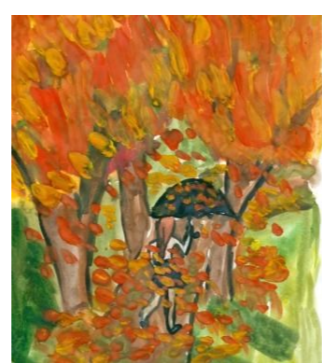
Рисунок Минкинен Валерии, 7 Г