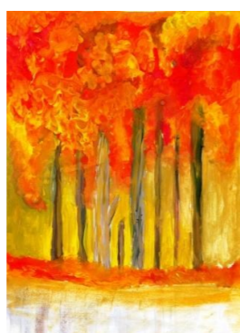
Рисунок Жуковой Саши, 5Б