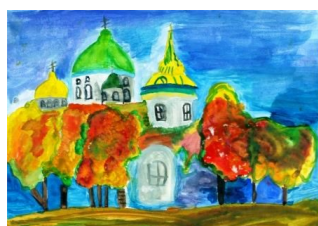
Рисунок Никифоровой Ксении, 6В