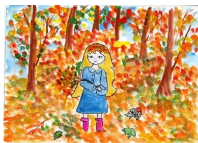
Рисунок Тищенко Кати, 7В