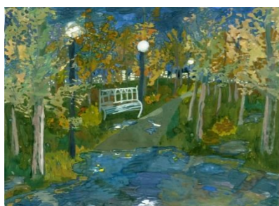
Рисунок Заровняевой Анны, 7 Б